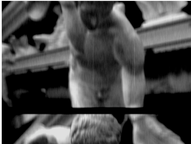
Regards de pierre , Pierre Yves Cruaud

Un vidéaste français fulgurant – immense et assourdissant météore déchirant la nuit du cinéma. A 35 ans, il a créé, seul, 12 vidéos monobandes, 2 installations vidéo disséminées à travers le monde, emportant avec elles une quinzaine de prix internationaux.