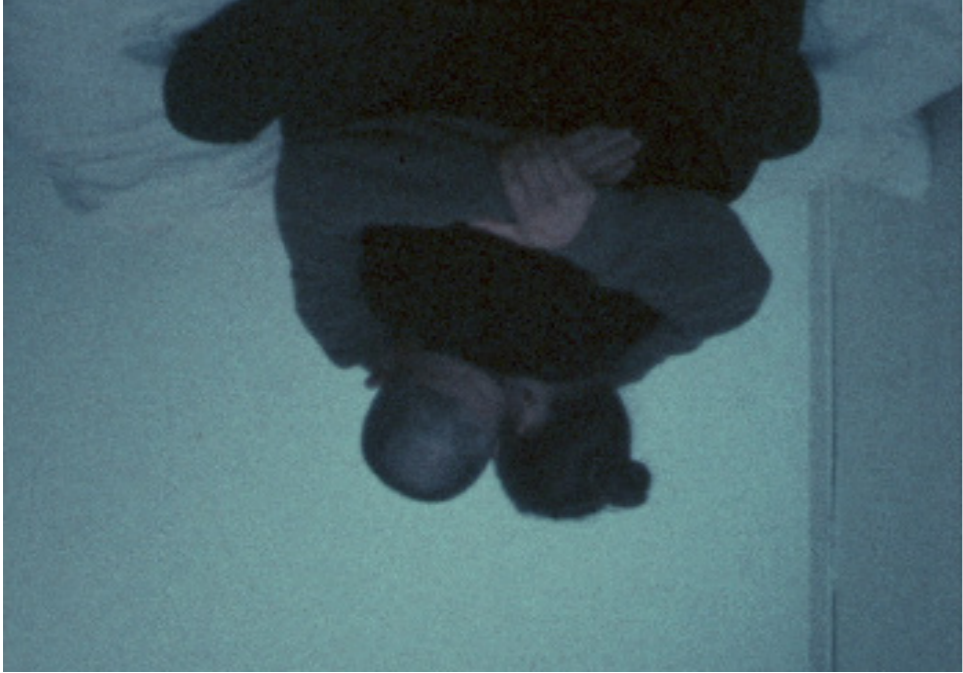
Still issu de l'ensemble Some Strings.

« Une tâche essentielle pour la pensée écologique est de créer des images qui manifestent les caractéristiques de notre environnement qui sont habituellement imper-ceptibles pour les humains. Ici donc, à des fins différentes, les objets sont partagés par les anima-teur. rices [expérimentaux.ales] et les écologistes : créer des images qui rendent visibles des phénomènes autrement invisibles, les premiers pour stimuler de nouvelles perspectives en rompant avec les habitudes d'utilisation du média [...], les seconds.es pour communiquer la gravité des déséquilibres écologiques qui, autre-ment, resteraient hors de portée de nos sens. » - Vicky Smith, « Experimental Time-Lapse Animation and the Manifestation of Change and Agency in Ob-jects », 2018